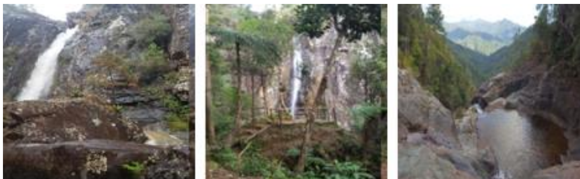
Figura 6. Exóticos atractivos en la zona de El Manguito.