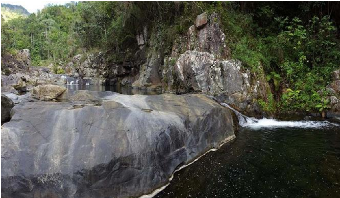
Figura 2. Poza la Redonda.

Los atractivos complementarios levantados durante el trabajo de campo son varios saltos de agua (Figura 2 y 3), dispersos en la zona, con el inconveniente de que se encuentran alejados a más de 1 hora de recorrido desde el atractivo focal en diferentes direcciones, por accesos con pendientes de más de 20 grados de inclinación y no ofrecen un gran atractivo visual por si solos, para valorarse como atractivos focales.