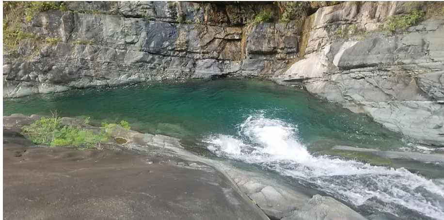
Figura 7. Poza de gran atractivo natural cercana a las instalaciones de la Comandancia del Che.

Pata de la Mesa, localizada en el municipio de Buey Arriba, el uso turístico propuesto es el recorrido por la Comandancia del Che en la Mesa (Figura 7), el atractivo fundamental es histórico y en menor medida paisajístico, en este sitio se propone realizar un recorrido de varias horas por las instalaciones de la Comandancia del Che en la Sierra Maestra y contar la historia de la misma.