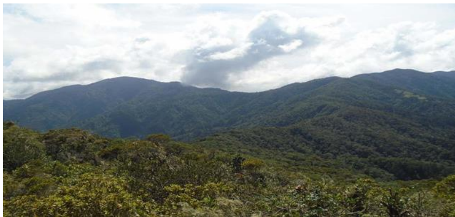
Figura 4. Imagen panorámica de hermoso paisaje en el Oro de Guisa.

Tiene como factor limitante, que para llegar a la zona de inicio del sendero se transita por zonas con restricciones de acceso por ser relevante de interés para visitantes entendidos del tema, lo cual es inconveniente para una propuesta de uso público desde la zona del Oro de Guisa.