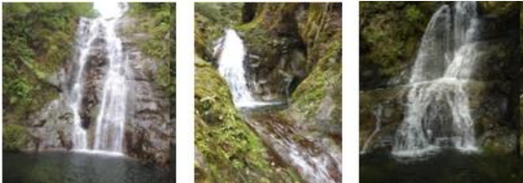
Figura 3. Saltos de agua en la zona de Colón.

su altura es 1 752 m sobre el nivel medio del mar, muestra excelentes visuales de 360 grados en su cima, se logra la observación de flora, fauna y los hermosos paisajes circundantes. Además esta distante unos 30 km de la cabecera municipal, accesible para vehículos de doble tracción por un terraplén que cruza el río en varias ocasiones y excelentes visuales de la zona montañosa, con un tiempo de viaje de aproximadamente 2 a 3 horas, en dependencia del estado del terraplén.